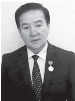
Ермек ЗӘҢГІРОВ, Қазақстан Жазушылар одағының мүшесі, ҚР мәдениет қайраткері.